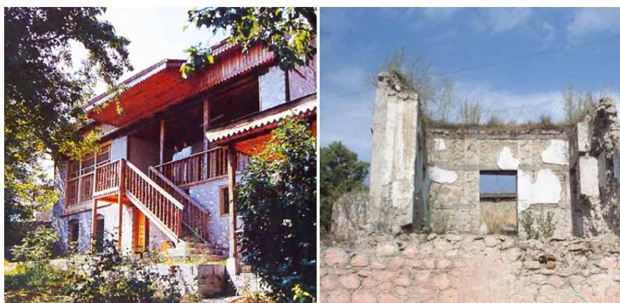
Рис. 3. Дом- музей Мир Мохсен Наваб

В облицовке зданий и сооружений с традиционной кладкой использовался очень твердый местный камень. Шушинские мастера не оштукатуривали наружные стены, но использовалась «растирка швов», чем достигалась ее исключительная живописность. В сочетании каменной кладки с чисто отесанными профилированными карнизами, междуэтажными тягами, арочными порталами и окнами очевидна взаимосвязь с традиционным каменным зодчеством Азербайджана. Климатические условия, топографические и многие др. факторы предопределили, в частности этажность имаретов, формы их перекрытий и пр. Связь с верхними этажами осуществлялась вынесенными открытыми или полуоткрытыми лестницами. Шушебенды, балконы, эйваны, резные наборные деревянные потолки (дворец Угурлу бека), лестницы, исполненные в дереве привлекают изяществом профилировки, выявлением красивой фактуры дерева. Широко использовалось шебеке, придававшее исключительную живописность композиции, цветовую живость, мажорность цветовых бликов в интерьерах, но не только, регулировалось проветривание помещений и пр. Стены, перекрытия, филенки дверей декорировались живописью, растительными и геометрическими орнаментами, букетами, вазонами и пр. (дом Мехмандаровых, дом Сафибековых, дом И. Рустамова, дом Мамедова, дом и мастерская Мир Мохсун Навваба (3, с.481, рис. 3). Синтез искусств в них достигает непревзойденных вершин.