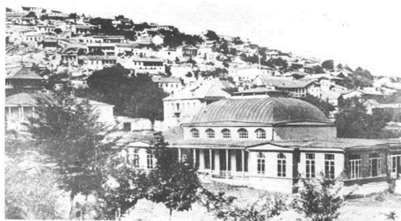
Рис. 2. Дворец карабахского хана

В облицовке зданий и сооружений с традиционной кладкой использовался очень твердый местный камень. Шушинские мастера не оштукатуривали наружные стены, но использовалась «растирка швов», чем достигалась ее исключительная живописность. В сочетании каменной кладки с чисто отесанными профилированными карнизами, междуэтажными тягами, арочными порталами и окнами очевидна взаимосвязь с традиционным каменным зодчеством Азербайджана. Климатические условия, топографические и многие др. факторы предопределили, в частности этажность имаретов, формы их перекрытий и пр. Связь с верхними этажами осуществлялась вынесенными открытыми или полуоткрытыми лестницами. Шушебенды, балконы, эйваны, резные наборные деревянные потолки (дворец Угурлу бека), лестницы, исполненные в дереве привлекают изяществом профилировки, выявлением красивой фактуры дерева. Широко использовалось шебеке, придававшее исключительную живописность композиции, цветовую живость, мажорность цветовых бликов в интерьерах, но не только, регулировалось проветривание помещений и пр. Стены, перекрытия, филенки дверей декорировались живописью, растительными и геометрическими орнаментами, букетами, вазонами и пр. (дом Мехмандаровых, дом Сафибековых, дом И. Рустамова, дом Мамедова, дом и мастерская Мир Мохсун Навваба (3, с.481, рис. 3). Синтез искусств в них достигает непревзойденных вершин.