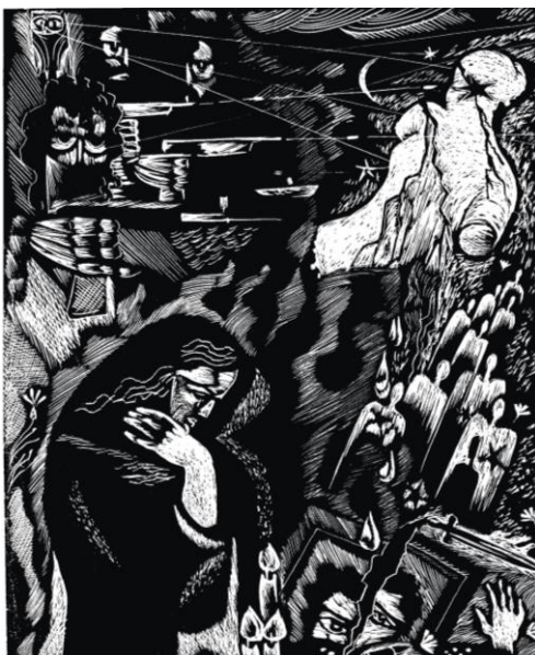
Şəkil 1. Şəhidlərin xatirəsinə [2]