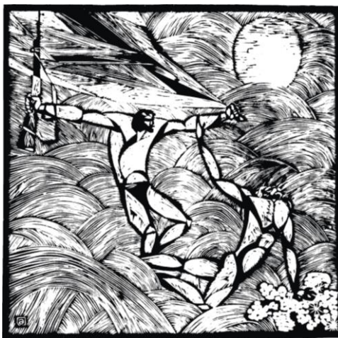
Şəkil 2. Həyat naminə [2]

Ədalət Həsənovun kitab- jurnal qrafikasını xronoloji ardıcılıqla dəyərləndirməli olsaq, onda ilk olaraq “Ulduz”un 1967-ci illərdə işıq üzü görmüş saylarını vərəqləməliyik. Belə ki, məhz həmin illərdə Azərbaycan oxucusu ilk dəfə ədəbi mətnə əvvəlkilərdən fərqli rəssam müdaxiləsinə şahidlik etmiş oldu. Doğrudan da gənc rəssamın Cəlil Məmmədquluzadə obrazı ilə yanaşı, Xalidə Hasilova, Nemət, Nurəddin Mirzəyev və Həmid Arzulunun hekayələrinə, Rəfiq Zəka, Məmməd Aslan, Abbas Abdulla və Hüseyn Razinin şeirlərinə bədii yanaşmasında qrafik ifadə vasitələrinin təzad yaratmaq gücündən bacarıqla istifadə olunmuş, cizgilərdə ifadə olunmuş mənə-məzmun yükü düşündürücülüyə bələnməmişdi.