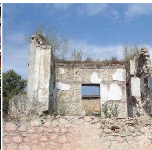
Рис. 3. Дом-музей Мир Мохсен Наваб

Особняки видных горожан строились на наиболее благоприятных, живописных частях города, с обычным разделением на хозяйственную часть на 1-ом этаже, тогда как гостевые и хозяйские помещения устраивались на 2-ом этаже. Архитектурно-художественное решение фасадов