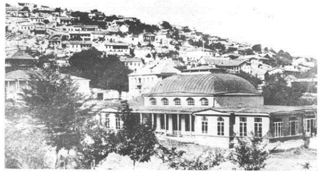
Рис. 2. Дворец карабахского хана

В облицовке зданий и сооружений с традиционной кладкой использовался очень твердый местный камень. Шушинские мастера не оштукатуривали наружные стены, но использовалась «растирка швов», чем достигалась ее исключительная живописность. В сочетании каменной кладки с чисто отесанными профилированными карнизами, междуэтажными тягами, арочными порталами и окнами очевидна взаимосвязь с традиционным каменным зодчеством Азербайджана. Климатические условия, топографические и многие др. факторы предопределили, в частности этажность имаретов, формы их перекрытий и пр. Связь с верхними этажами осуществлялась вынесенными открытыми или полуоткрытыми лестницами. Шушебенды, балконы, эйваны, резные наборные деревянные потолки (дворец Угурлу бека), лестницы, исполненные в дереве привлекают изяществом профилировки, выявлением красивой фактуры дерева. Широко использовалось шебеке, придававшее исключительную живописность композиции, цветовую живость, мажорность цветовых бликов в интерьерах, но не только, регулировалось проветривание помещений и пр. Стены, перекрытия, филенки дверей декорировались живописью, растительными и геометрическими орнаментами, букетами, вазонами и пр. (дом Мехмандаровых, дом Сафибековых, дом И. Рустамова, дом Мамедова, дом и мастерская Мир Мохсун Наваба (3, с.481, рис. 3). Синтез искусств в них достигает непревзойденных вершин.