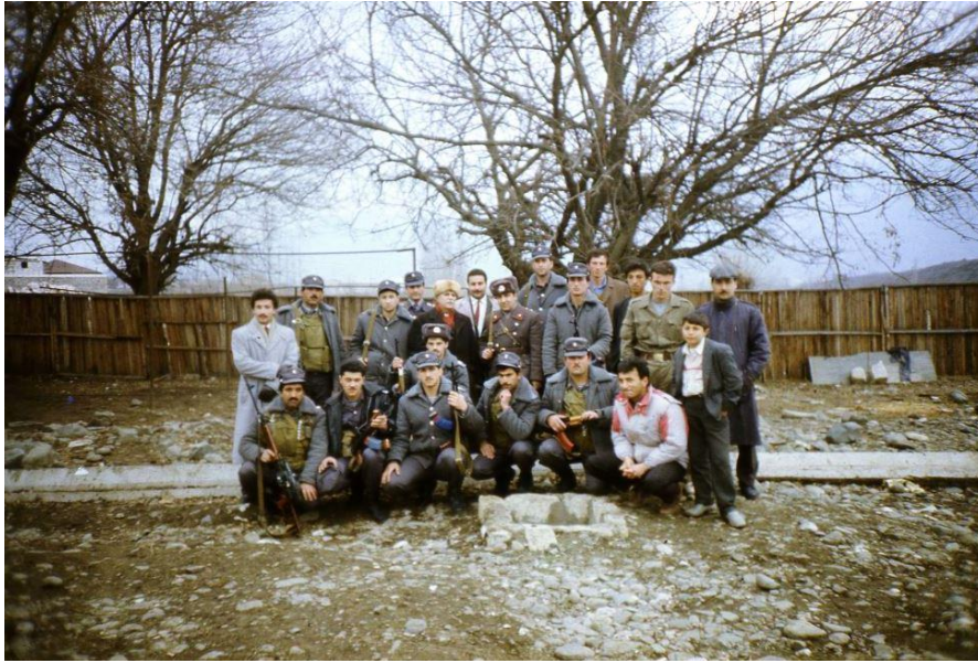
Şəkil 1. Xocalı şəhərində 1991-ci ildə şəhəri müdafiəçiləri ilə