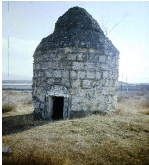
Şəkil 2. Xocalı şəhəri ərazisində yerləşən Xoca Əli türbəsi (XIV əsr)

Sol sahildə yerləşən qalanın digər hissəsi isə düzbucaqlı və trapesiya formalı istehkamların qovuşmasından yaranmış bir müdafiə qurğusudur. Qala divarlarının hündürlüyü bəzi yerlərdə 9 m və qalınlığı 2 m qədər çatır. Bu divarlar doğranmış çay daşından tikilmişdir [5, s.322].